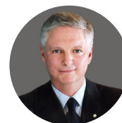
Paul DESMARAIS Jr.